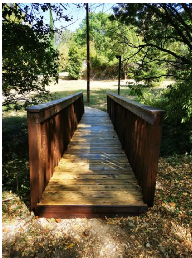
Le pont ! ...oui, c'est par ici !!

Les Oliviers - Loriol - Tel : 04 75 61 00 55 - www.hotel-les-oliviers.eu